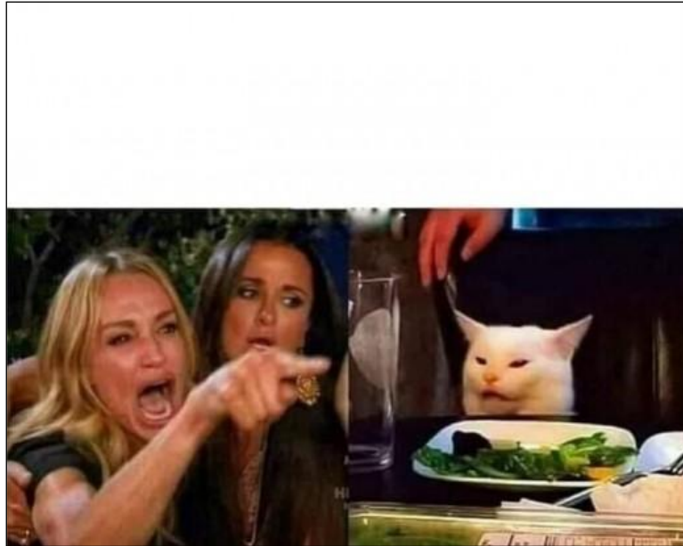
Imagen 5.

Este meme es una composición de dos referencias distintas. Del lado izquierdo, tenemos un fotograma de la serie de televisión The Real Housewives of Beverly Hills (Bravo), en el personaje Taylor Armstrong grita, en medio de una discusión, y señala a alguien. Del lado derecho, se puede ver a un gato frente a un plato de ensalada, haciendo lo que parece ser un gesto de desagrado. Este gato es conocido como Smudge y es un personaje de la red social Instagram. Ambos elementos han sido ubicados de tal forma que da la impresión de la que mujer reclama airadamente algo al gato y este responde con socarronería. El meme es empleado para parodiar una situación en la que alguien reclama a otro por una expectativa insatisfecha y el aludido corrige la impresión de aquel con sorna o cinismo.