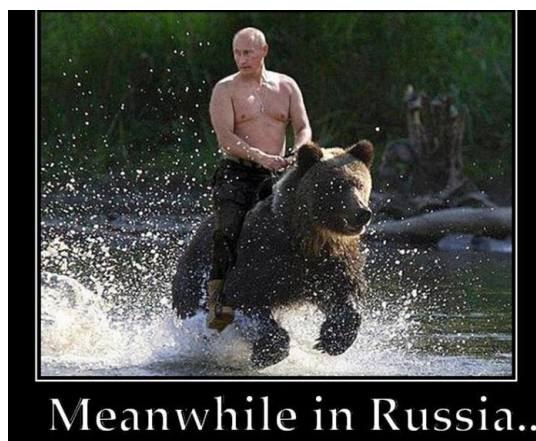
Imagen 1.

Es por esto que también los memes muestran lo grave en situaciones aparentemente felices o ideales. El uso de la hipérbole, la plasticidad, el ridículo e, incluso, de la distorsión consciente va a representar para el creador del meme y para quien lo comparte la oportunidad de presentar el evento en cuestión desde una perspectiva humorística, como se observa en la Imagen 1.