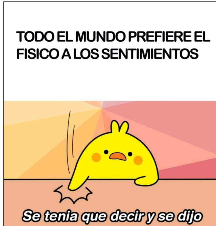
Imagen 8.

Fernández de la Vega resalta que el humor relativiza determinadas situaciones que pueden considerarse dolorosas o trágicas. En este meme, vemos dicha relativización, pero orientada a presentar como cierta una generalización incómoda. Los memes que apelan a hipérboles o provocaciones enunciativas se presentan de forma ofensiva para apelar a la escala de valores del lector, para identificarse o distanciarse de lo expuesto. La declaración de la Imagen 8 es polémica porque pone en entredicho la noción, socialmente correcta, de que el físico, como equivalente de belleza, no debe estar por encima de la personalidad (los sentimientos, según este enunciado). Se entiende, en este contexto, que el emisor declara, con intención satírica o irónica, la convención de que las personas afirman preferir los sentimientos antes que la belleza, porque de lo contrario pueden ser considerados superficiales. Es importante resaltar que no es posible establecer si el autor del meme realmente cree lo que afirma o si sólo tiene la intención de generar un debate en torno al tema planteado. Como se ve, la apelación al lector también juega un papel esencial en este caso.