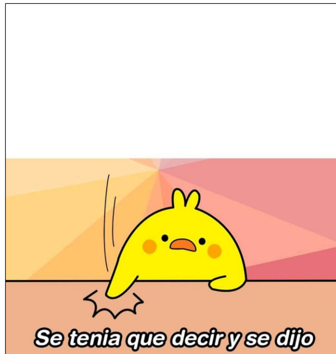
Imagen 4.

Este meme no parte de una referencia de la cultura popular expresa. La composición consta de un personaje central, un pollo amarillo que golpea una mesa en actitud desafiante, y un enunciado base, “Se tenía que decir y se dijo”. El meme es empleado para presentar opiniones controversiales o impopulares, con la intención de zanjar acuerdos tácitos o de resolver silencios cordiales en torno a temas álgidos. El contraste entre la imagen tierna del pollo y su actitud decidida suaviza la rigidez del enunciado principal.