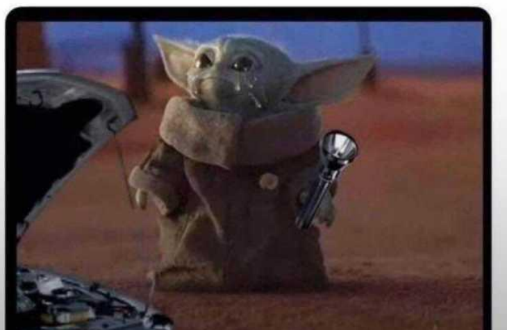
Imagen 6.

Cuando le ayudas a tu papa a arreglar el carro para aprender, pero solo aprendiste a agarrar una linterna y a que te griten.