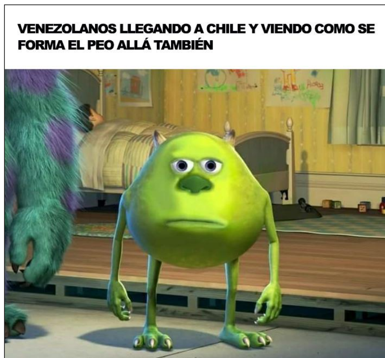
Imagen 7 4 .

La Imagen 7 es mordaz y su trasfondo irónico. Aquí también opera una apelación al lector, ya que la condición de los inmigrantes venezolanos es ampliamente conocida. Con el significado de esta plantilla, explicada en la sección anterior, se destaca la impresión decepcionante que debió causar entre los ciudadanos venezolanos que salieron de Venezuela debido a la profunda crisis política del país, encontrarse con un estallido social en Chile. Este meme remite directamente a lo planteado por Fernández de la Vega al decir que el humor sigue la máxima de Spinoza: “Ni reír ni llorar, sino sacar conclusiones”. Del mismo modo, este meme plantea lo que Pérez-Salazar cataloga como la función del meme en tanto que representación subjetiva del mundo, dado que se trata de una exteriorización de los sentimientos de decepción que rodean al acto de emigrar buscando mayor estabilidad política y encontrarse con un escenario de protestas sociales.