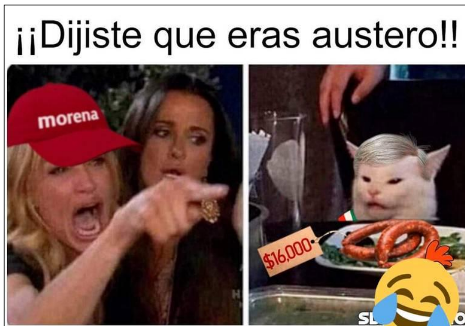
Imagen 9.

En la imagen 9, encontramos una declaración de tipo paródico del tema político. Morena (Movimiento Regeneración Nacional) es un partido político creado por el actual presidente de México, Andrés Manuel López Obrador, con el propósito de ofrecer una alternativa a las opciones del PRI y el PRD, partidos tradicionales del país azteca. En este meme, se interviene la plantilla para introducir varios elementos. Primero, una gorra o cachucha en el personaje de la mujer que grita al gato, con lo cual se parodia a un militante del Morena. Luego, se agrega un cabello canoso al gato de actitud cínica, para parodiar una característica física del presidente López Obrador. Por último, se agrega un plato exageradamente caro, 16.000 mil pesos mexicanos -unos 600 dólares americanos-. El enunciado “¡¡Dijiste que eras austero!!” completa el meme-afiche. Una descripción apropiada de la escena sería la siguiente: Un militante del Morena reclama al presidente López Obrador que él se promocionó como más moderado en cuanto a gastos en comparación con los políticos tradicionales, pero también hace gastos dispendiosos en cosas triviales.